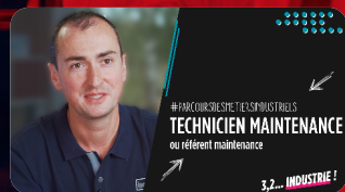
Technicien de maintenance BCF LIFE SCIENCES