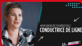
Conductrice de ligne ENTREMONT