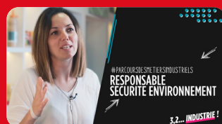
Responsable QSE SOREAL